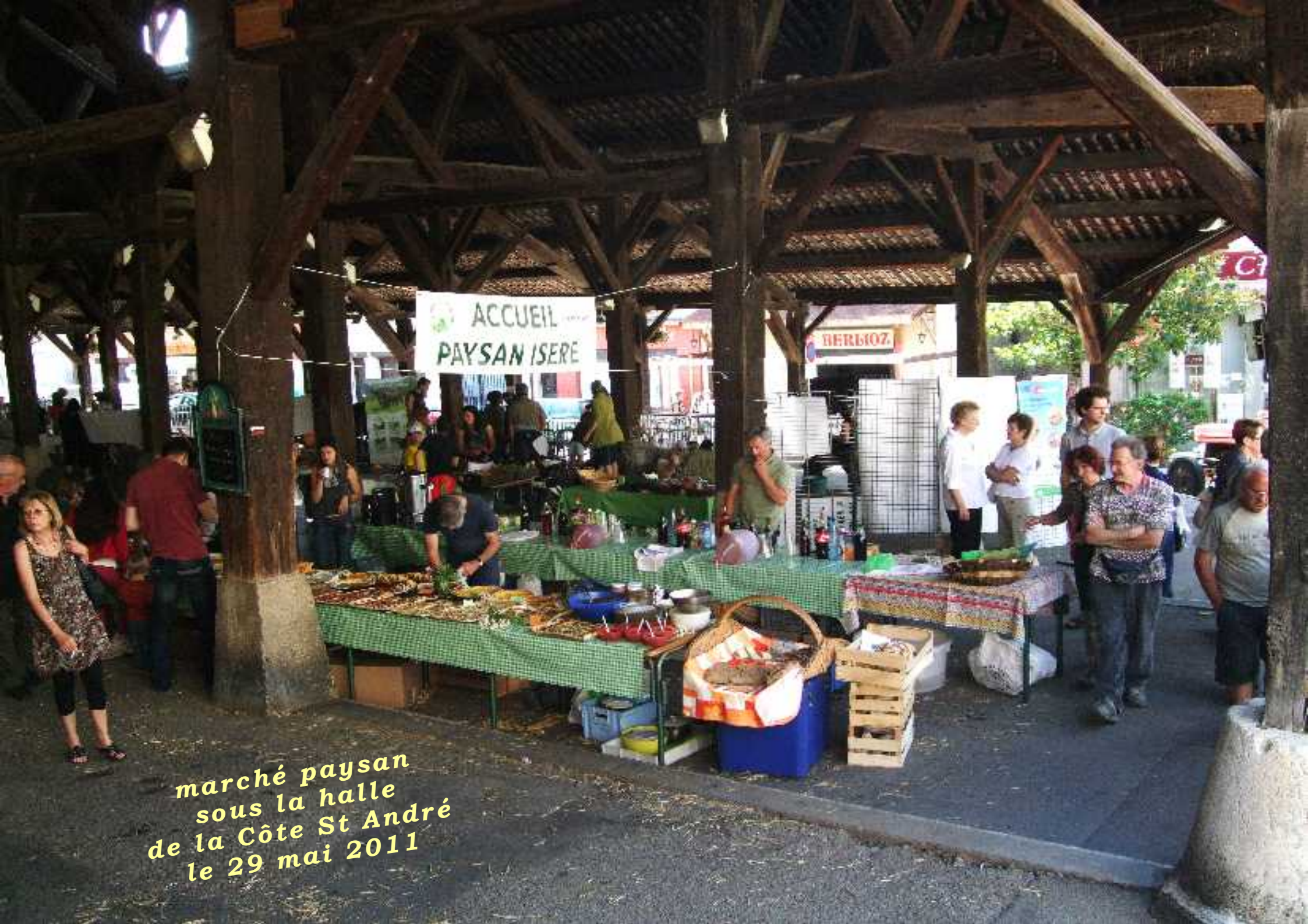
marché paysan sous la halle de la Côte St André le 29 mai 2011