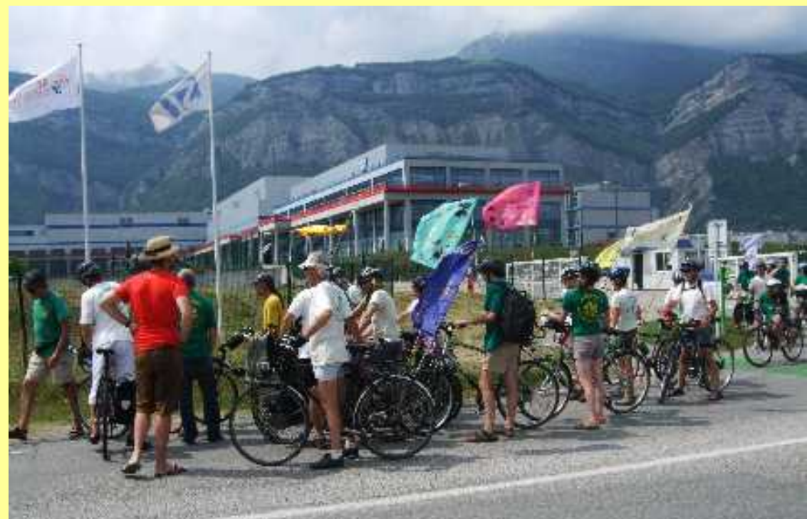
les altercyclistes devant une entreprise d'électronique à Crolles, en Isère, le 9 juillet 2011

Les Amis d'Accueil Paysan se sont associés à Attac-Isère, Alliance PEC-Isère, les Amis de la Terre, Les Bas Côtés, pour assurer l'intendance, l'accueil et l'animation de cette journée à Grenoble.